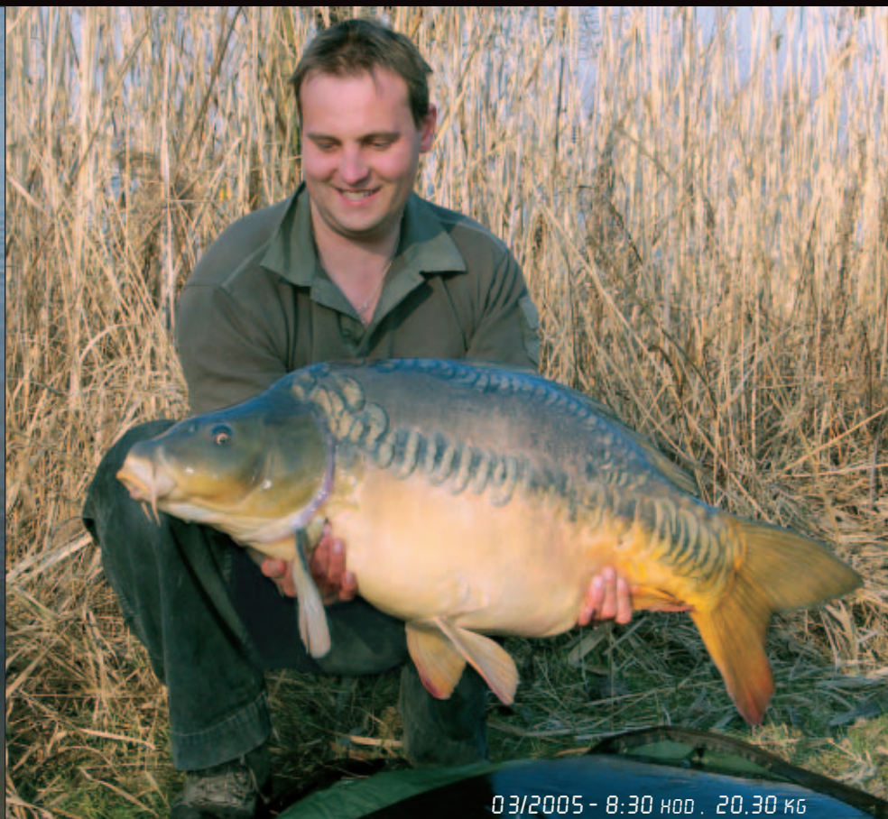
03/2005 - 8:30 HOD . 20,30 KG

A v 10.00 hod se opravdu dočkal. Podařilo se mu zdolat po druhé za jednu výpravu Oliho - tentokrát rovných 20 kg.