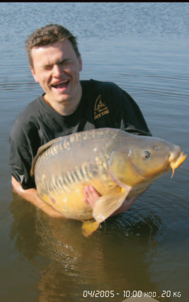
04/2005 - 10:00 HOD . 20 KG