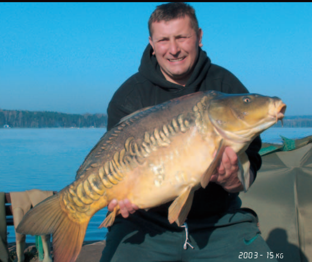
2003 - 15 KG

A proč jsme mu vlastně dali jméno Oli? Jak jednoduché. Pokaždé jsme ho totiž ulovili na směs Biosquid s amino complexem oliheň