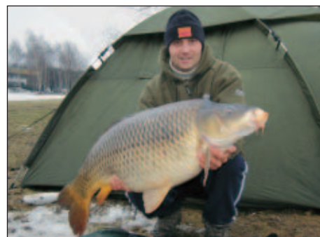
Jeden z dalších úlovků z února - 17,80 kg

30. března v 8.30 hod se mi to opravdu podařilo. Poprvé jsem zdolal fascinujícího řádkáče